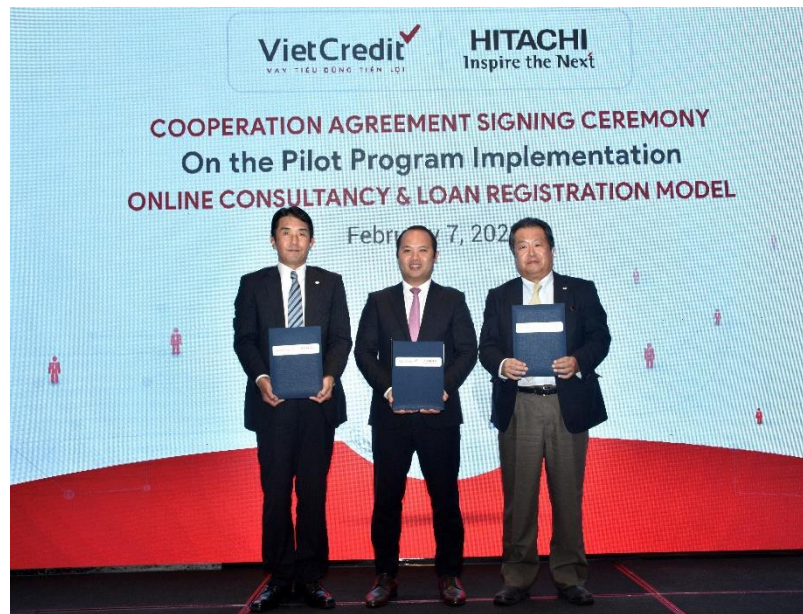
Buổi lễ ký kết

Huế, Việt Nam - Vào ngày 10 tháng 2 năm 2020, Công ty Cổ phần Tài chính Tín Việt (VietCredit), Công ty TNHH Hitachi (Hitachi) và Công ty TNHH Hitachi Asia Việt Nam (Hitachi Asia Vietnam) đã ký thỏa thuận hợp tác triển khai thí điểm chương trình Chương trình thử nghiệm Mô hình đăng ký vay trực tuyến kết nối trực tiếp với tư vấn viên.